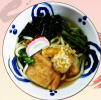
Topped with mixed vegetable tempura, kitsune, seaweed